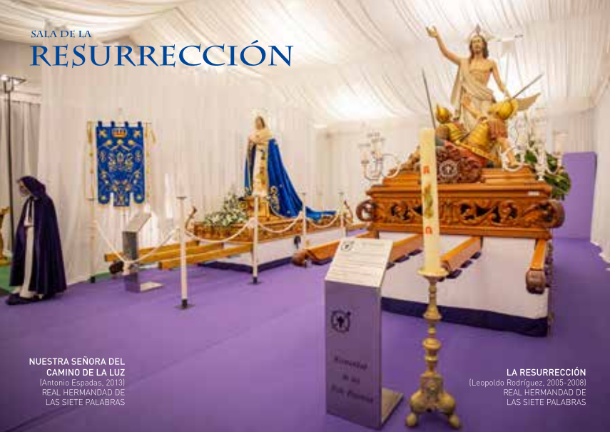
NUESTRA SEÑORA DEL CAMINO DE LA LUZ (Antonio Espadas, 2013) REAL HERMANDAD DE LAS SIETE PALABRAS