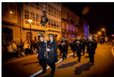
Banda Ntra. Sra. de la Misericordia de Viveiro Fundación 2008 Componentes 48