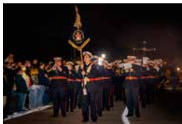
Banda Naval de Viveiro Fundación 2002 Componentes 58