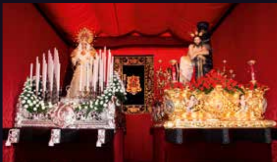
CAPILLA PROCESIONAL PAZO DE LA MISERICORDIA