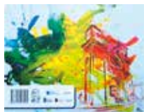
▲ Portada y Contraportada del libro.