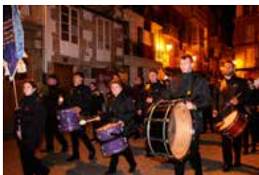
Banda Municipal de Música de Foz Fundación 1993 Componentes 40