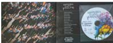
CD del Libro y repertorio del mismo ►►