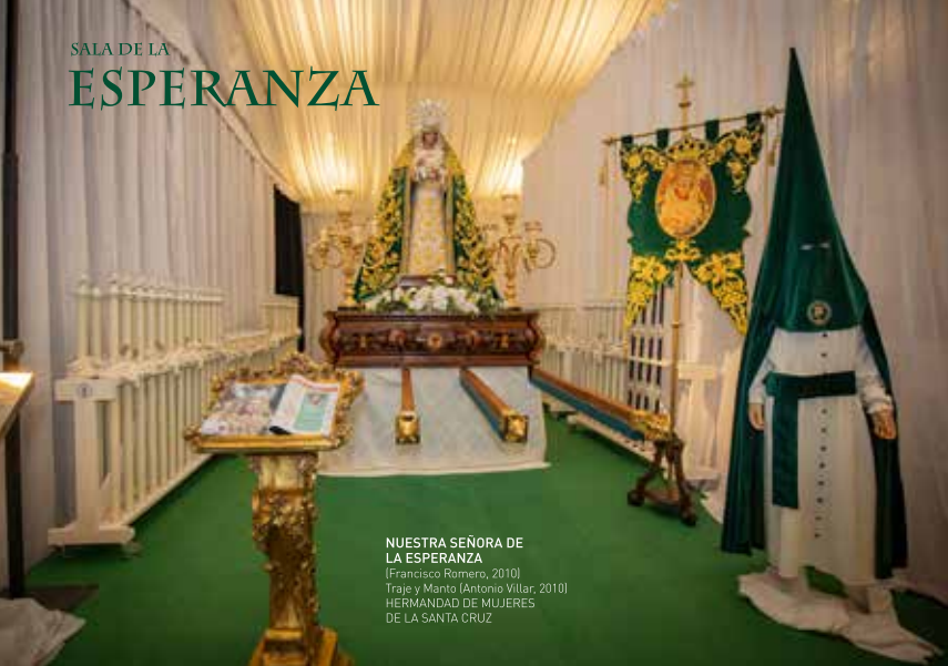
NUESTRA SEÑORA DE LA ESPERANZA (Francisco Romero, 2010) Traje y Manto (Antonio Villar, 2010) HERMANDAD DE MUJERES DE LA SANTA CRUZ